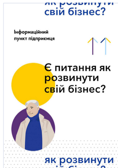
листівка для тейбленту